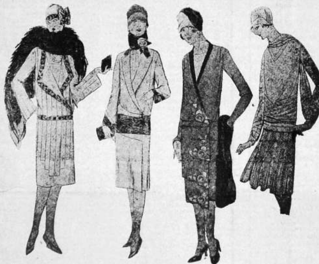
Los nuevos modelos

Por cierto, que en esta materia, el magín de los sastres realiza verdaderas maravillas, admirables prodios, respondiendo con creces al espíritu de novedad, de positiva elegancia y del más refinado buen gusto, tendencias hacia las que converge la nunciación bien saciada coquetaría femenina.