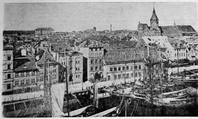
KOENIGSBERG (Vista tomada desde la Bolsa)

Esta fue ciudad de la nobleza prusiana, segunda residencia del rey, capital de Prusia, situada sobre el Pregel, distante 380 kilómetros de Berlín. Posee una célebre universidad fundada en 1544, bibliotecas, el palacio de Keiserling y la estatua ecuestre de Federico Guillermo III. Su población tenía hacia 1892, 111,700 habitantes, dedicados al comercio en su mayor par-