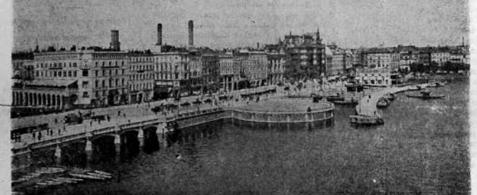
HAMBURGO y el hermoso Elba

tándola sobre una montaña llamada Monte del Rey, en honor del soberano Otakar de Bohemia, quien tomó parte en una de las cruzadas de la orden (1255). Próximas se hallan las grandes lagunas Frisidie Häff y Kurische Häff. Como se verá por el grabado que reproducimos, ofrece al viajero un hermoso golpe de vista.