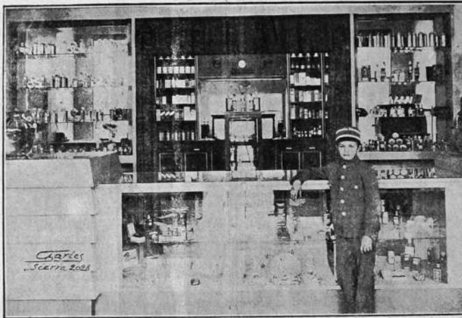
VISTA PARCIAL DEL DESPACHO Y LABORATORIO