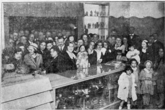
Señoritas y caballeros de nuestra sociedad que asistieron al lunch ofrecido por los propietarios de la gran "Farmacia Uruguay" con motivo de la inauguración de su propio y nuevo local.

Consultorio Peñarolense. — 1º EL CUTIS CRASO sigue las variaciones del tiempo, como Ud. ha notado aunque lo clasifica de otra manera. 2º SE RESTAURA LA TEZ, QUE HA EMPEZADO A MARCHITARSE, con un método sencillo que tiene la ventaja de quitarle su aspecto turbio y manchoso. He lo aquí: Llenar una taza con rábano stiveño, rapado, y agregar un cuarto de