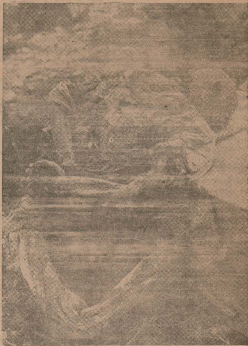
Uno de los numerosos cadáveres exhumados en el pozo de «La Lagartas», del término de Tabernas.