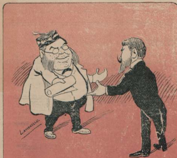
6.—Oído lo cual se le nombra a Vd. ministro, consul ó attaché en París, en San Petersburgo ó en la gran China.