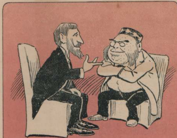
5.—...agregando que desea Vd. hacer un viaje en el cual no estarían demás ciertas facilidades diplomáticas.