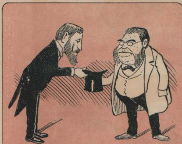
4.—Obtenido esto, lo participa Vd. al que todo lo puede.... menos recobrar su perdida popularidad,