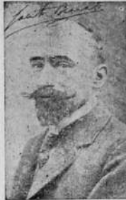
JACINTO BENAVENTE EL GLORIOSO AUTOR DE "LOS INTERESES CREADOS"

El 4 de Febrero se realizó un baile en el centro "Lacacia" que como los anteriores se rió coronado por el éxito.