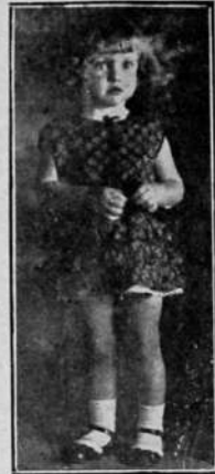
CHICHITA, la mascota de Sayago