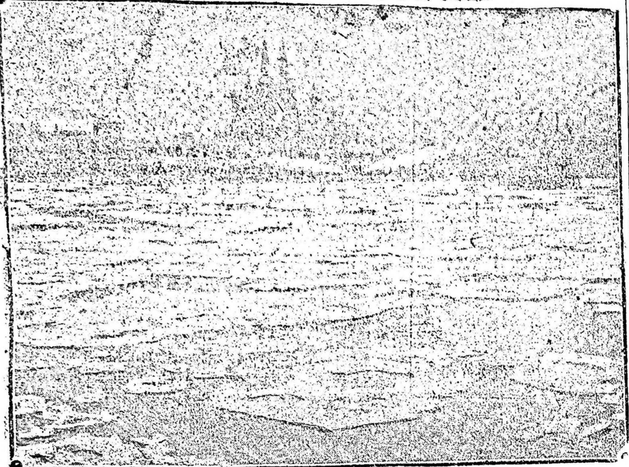
Defensa de las costas Alemanas