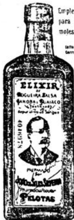
LIQUOR DEPURATIVO DE LA SANGRE LA TIENDA DE TODAS LAS FARMACIAS Y QUIMICAS