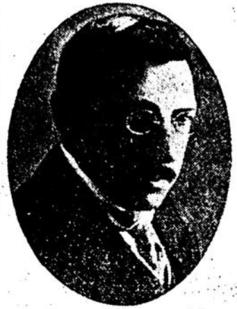
Eminente estadista candidato del Partido Colorado y de EL HERALDO a la Presidencia del Consejo N. de Administración

que siempre es codiciada y que desgraciadamente despierta envidia y que evanece, y no reina la sinceridad de sentimientos, puros, verdaderos que ennoblecen. Se ven las carabanas de dolientes que recorren sus avenidas con aires de transientes que cuidan más de sus lujosos atavíos, de fingir tristezas, llantos y de adoptar posturas inadecuadas con la solemnidad del día.