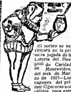
Segundo GRAN CONCURSO.