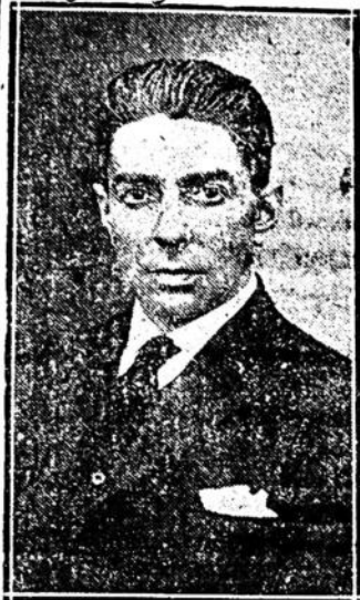
Candidato del Batllismo departamental a la Representación Nacional

tramos una respuesta: el Concejo no paga porque no quiere o porque le conviene, en estas postrimerías electorales, aparentar una legalidad que nunca ha practicado.