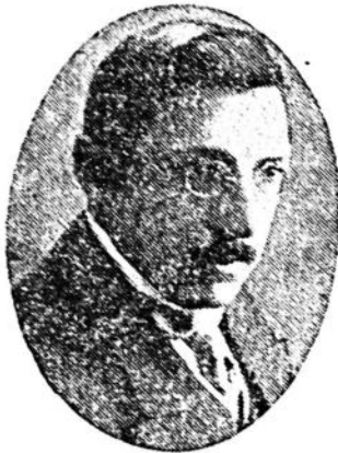
Candidato del Partido Colorado a la Presidencia del Consejo Nacional de Administración