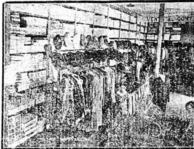
SECCION ARTICULOS PARA HOMBRES DE LA CASA BRITOS