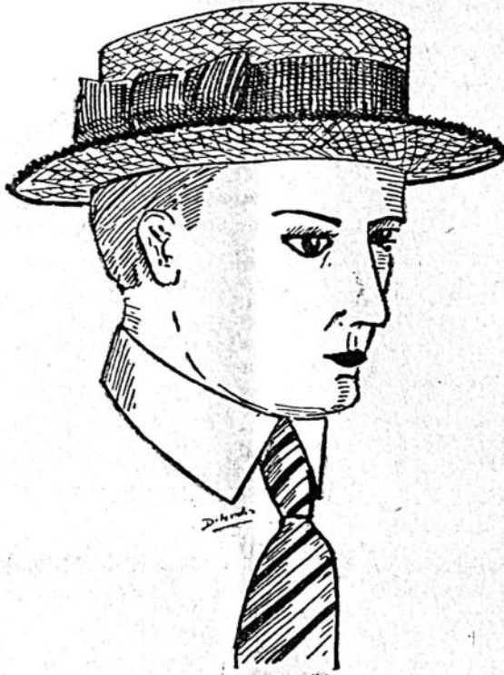
TIPO DE GRAN MODA, EL PREFERIDO DE TODOS