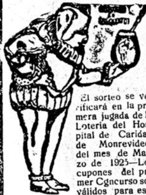
Segundo GRAN CONCURSO.