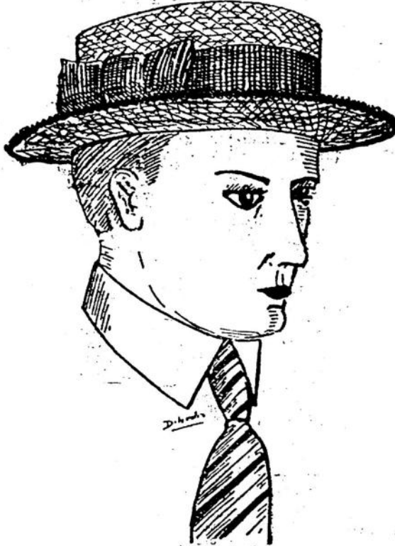
CONOTIER TIPO DE GRAN MODA, EL PREFERIDO DE TODOS