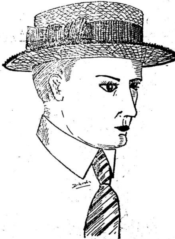
CONOTIER TIPO DE GRAN MODA, EL PREFERIDO DE TODOS