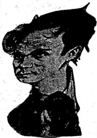
El futuro paladín del feminismo