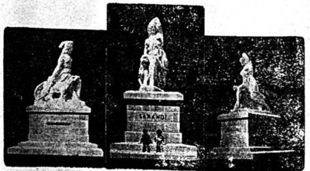
TRES ASPECTOS DE LA HERMOSA OBRA DEL ESCULTOR ZORRILLA DE SAN MARTIN QUE SE INAUGURARÁ EL 12 DE CORRIENTE.