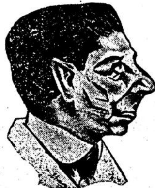
El Sr. Diputado