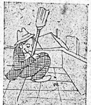
—De quién viene siendo el Tanque de Cau o de don Percho?