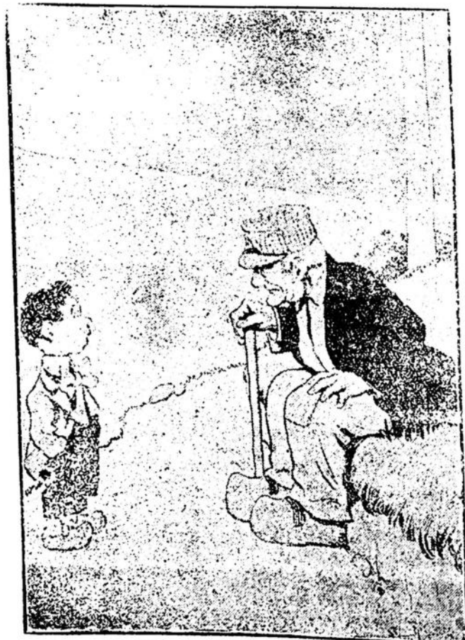
El niño:—Abuelito: de quien viene siendo el tanque?