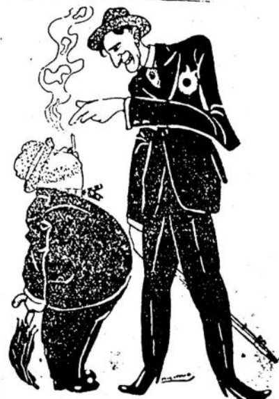
—El tanque no es el tanque. El tanque viene siendo uno de aquellos dos molinos.