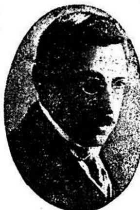
El eminente correligionario que nos visitará mañana

circunstancia de que haya o no mediado lucha. El hecho de que no haya sacado el revolver de la cartera al cadáver, para hacer creer que obró en defensa propia, revela que el Sr. Rodríguez no cometió su acción después de prolija deliberación, en forma premeditada. Adviértase cómo esta sola circunstancia modifica considerablemente y en favor suyo el grado de su responsabilidad, legal y moral.