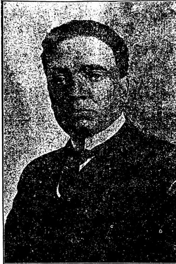
Dr. BALTASAR BRUN Candidato del Partido Colorado Batllista a la futura Presidencia del Consejo Nacional de Administración