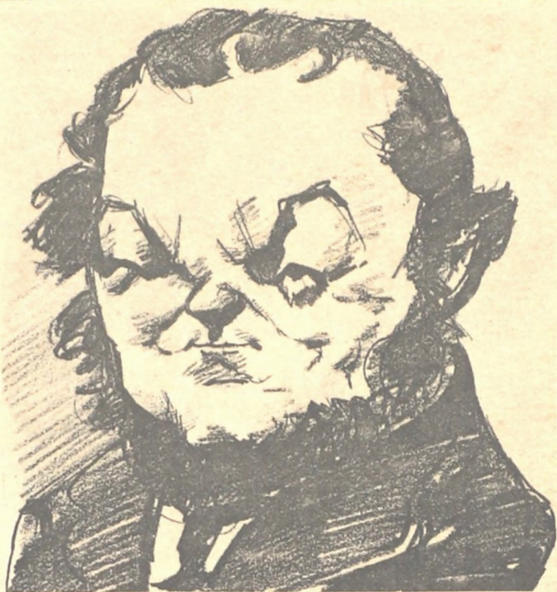
Desde París, escribe Ingrid Tempel