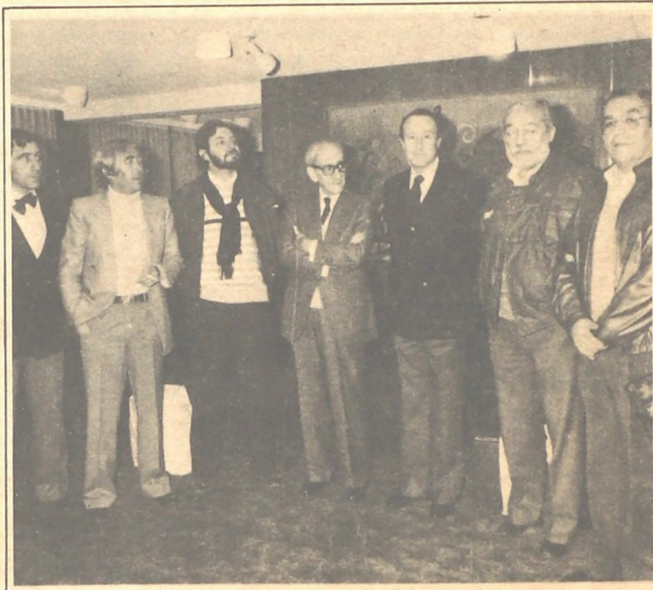
Al centro Gutiérrez Mellado, rodeado de los otros prestigiosos participantes de este importante simposio acerca de la transición española

Y responde Gutiérrez Mellado: "Efectivamente, el señor militar ha estado peor que mal pagado. Se prescindió del Ejército, como tal Ejército, para las cuestiones de Gobierno. Por un lado, era positivo aislarlo de la política. Es cierto que algunos jefes ostentaron cargos políticos, pero la verdad es que el Ejército como tal no influyó en la política. Era un militar quien