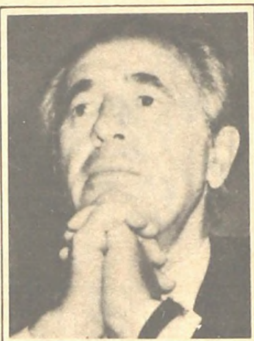
El país abierto al universo o Israel como refugio: esta elección un poco decide esto.

En ningún punto la diferencia práctica y a largo plazo aparece con mayor claridad que en el modo en que ambos par-