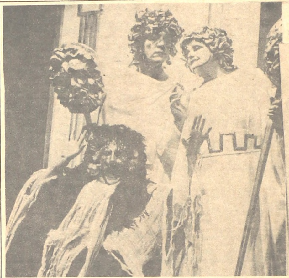
"Pluto" de Aristófanes: la burla a través de la sátira.

La puesta en escena de Ruben Yáñez logra rescatar una violencia increíble, del texto, vitalizando la acción con anacronismos válidos que son parte esencial de la fresca y divertida transcripción de la antigua comedia ateniense que nos llega así