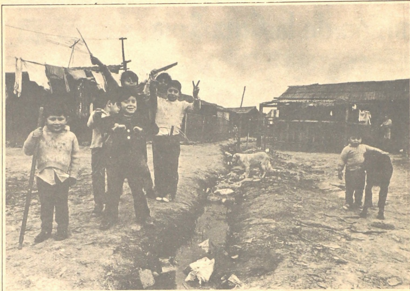
En el "cantegril" hay desnutrición crónica en los niños y alta incidencia de las enfermedades de transmisión sexual. El control de la natalidad y la planificación familiar se hace más difícil allí donde serían más necesarios.