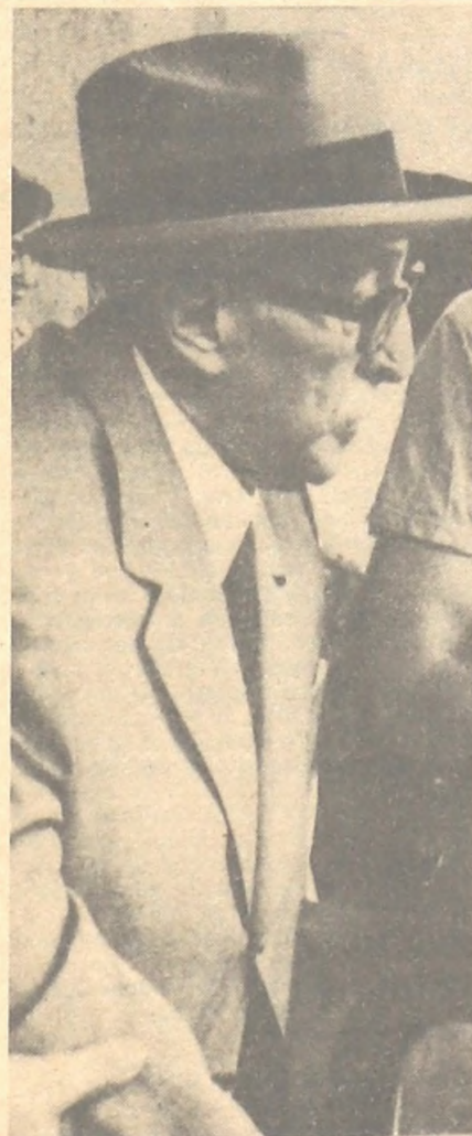
Don Claudio Sánchez Albornoz

Durante estos años no tuve plazo sobrado para seguir saboreando los tesoros de la biblioteca paterna que, dicho sea de paso, nos fue robada por los