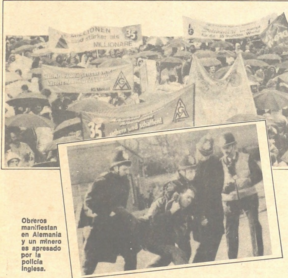
Obreros manifiestan en Alemania y un minero es apresado por la policía inglesa.

La mayoría de los gobiernos han contrarrestado los problemas financieros con medidas relativamente suaves, incluyendo de-