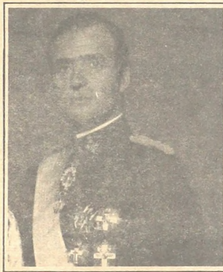
LA NOSTALGIA DE UN GOBIERNO DESCENTRALIZADO

En los últimos dos meses Juan Carlos ha recorrido una serie de ciudades medievales, como Ávila y Valladolid, que forman parte de la comunidad autónoma de Castilla, y también hizo una visita oficial a la comunidad de La Rioja, centro de la zona vitífera española. En sus discursos, pronunciados desde los balcones de las alcaidías, y escritos de acuerdo a sus instrucciones por su red de consejeros, Juan Carlos enfatizó la unidad de España.