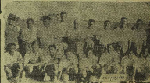
Los tricolores, confiados en sus prestigios decanos, están siempre dispuestos a jugarse enteros para agregar una nueva Copa a las que ya disponen. Es así que mañana frente a San Lorenzo serán muy serios rivales.