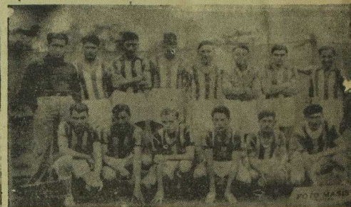
Los azul-grana serán los encargados mañana, de dirigir con Nacional la posesión de los primeros puntos de la disputa de la Copa «Arbol de Artigas» que se inicia mañana a las 13 y 30 en el Parque Leal.