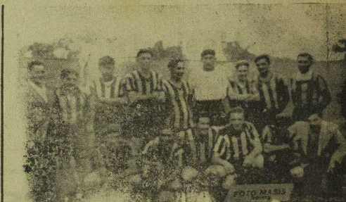
El equipo aurinegro, reforzado con elementos de reconocida valía en la segunda parte del programa frente a Ferrocaril, inaugurará su hermoso field en la disputa de la Copa «Arbol de Artigas» sindicándose como uno de los probables dueños del hermoso trofeo.