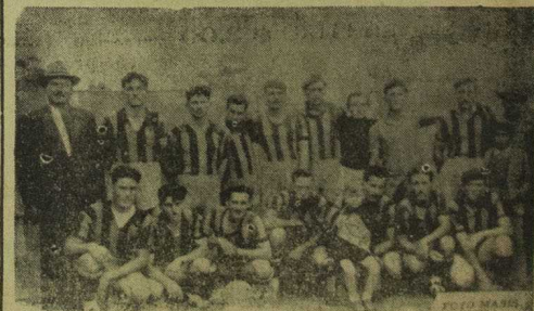
Los verdí-rojos, recientes ganadores de la Copa «Tassano» y de quienes sus parciales esperan otra descolante actuación, con fines de hacer «ambo» con la Copa «Arbol de Artigas». Mañana jugará con Peñarol en el segundo partido de la tarde en el Parque Leal.