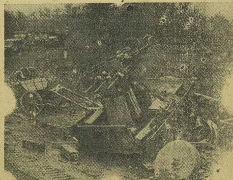
Pruebas de la puntería de precisión que acompaña los avances del ejército estadounidense. Pasan vehículos del ejército norteamericano ante baterías del enemigo silenciosamente destruidas momentos antes.