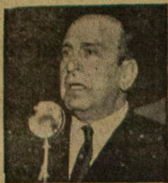
Un Presidente democrata uruguayo para la democracia americana