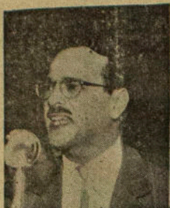
Dr. Carlos Manini Ríos