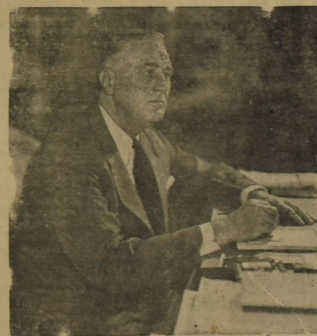
The President of the United States, Franklin D. Roosevelt