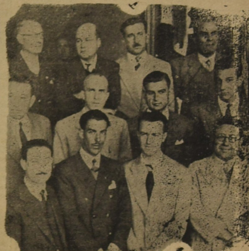
EL Secretario General de la F.U.E.C.I., y parte de la delegación del Interior, concurrentes al Primer Congreso Nacional