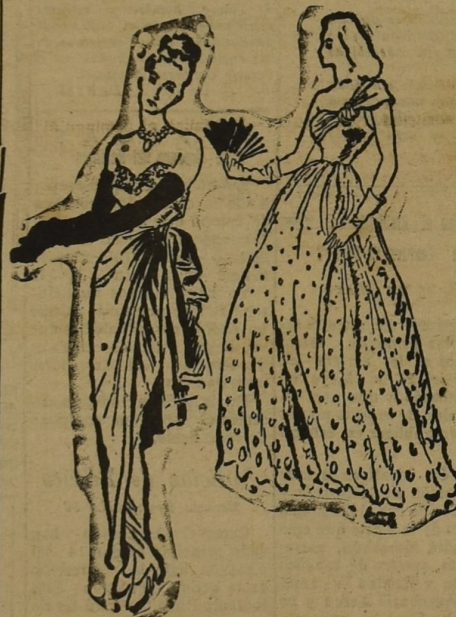
Dos modelos diseñados por los mejores modistos franceses para la noche.

Piguet se esmera principalmente en los corpiños. Presenta un hermoso conjunto dos—piezas, azul—marino y mostaza, cuya sisa simula la casulla mediante tres bandas azul—marino de ancho desigual, incrustadas sobre la manga mostaza. Las mismas aplicaciones de bandas marinas se repiten en la parte baja del "jumper" que llega hasta las caderas. La falda es completamente plisada, con grandes tañones huecos.