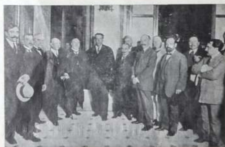
Batlle y un grupo de amigos