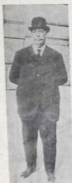
El Sr. José Batlle Ordóñez el día que se casó