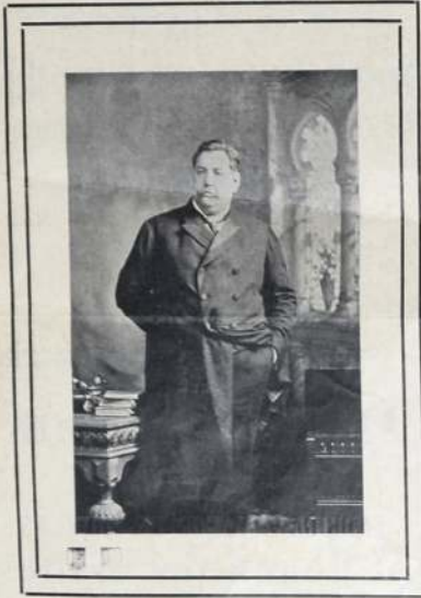
El señor Batlle en 1927

la acción del nuevo mandatario, tendrá en el futuro, el altísimo precio de todo un batallón contra elementos retrógrados y aristocráticos para la marcha de nuestra incipiente democracia.