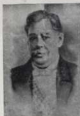
Reproducción del cuadro del Sr. Soto