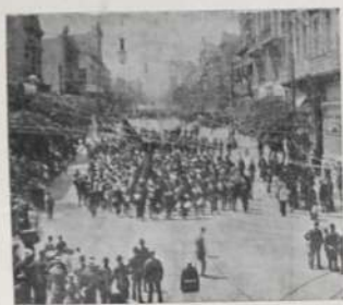
Notas graficas de la gran manifestación