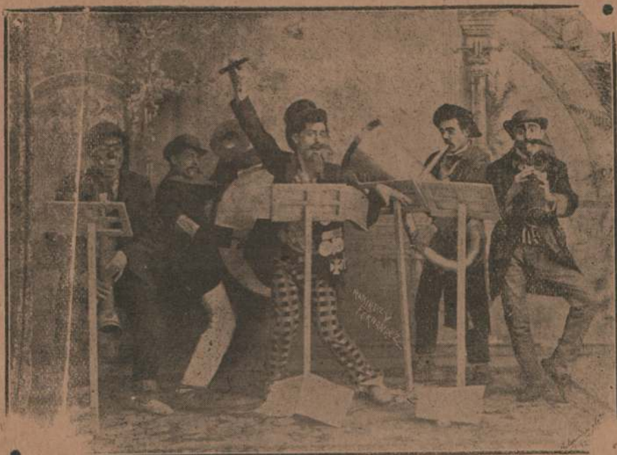
LOS PIRIPITIMI (CASINO)

hizo en demanda de mi opinión sobre el bombazo del siglo le contesté, más ó menos, con estas palabras: «¡Ah! mi amigo; quiera Dios que esta interrogación de Río Branco no nos ahogue, con el tiempo, en un río rojo !» Y me fui á dormir.