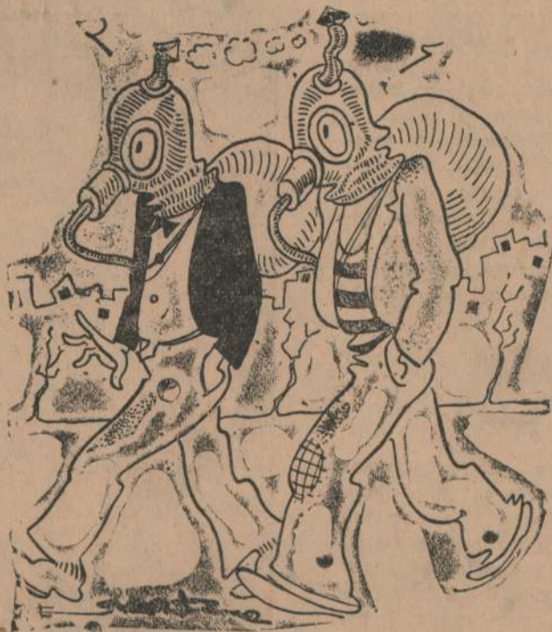
Patrulla inglesa buscando al "Royal Ark"