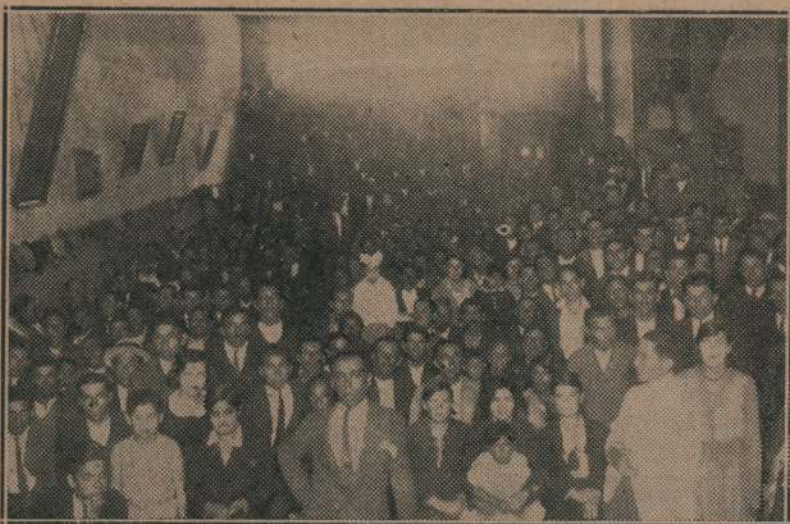
Gran mitin de desocupados que se efectuó en Valparaíso, en la sede del Sindicato de O. del Transporte, a pesar de las agresiones policíacas fascistas

En esta forma el proletariado chileno ha logrado efectuar una potente y significativa demostración de su voluntad de combate. Han sido rotos los marcos de la "legalidad" fascista, se ha pasado por encima de las leyes sangrientas de Ibáñez. Miles de obreros, bajo la bandera de la gloriosa FOCH, han intervenido en una lucha seria, por sus reivindicaciones, contra la bárbara opresión política del