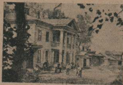
Casa de reposo para marineros en la Unión Soviética

¡Formad filas en las demostraciones proletarias del 1.º de Mayo!