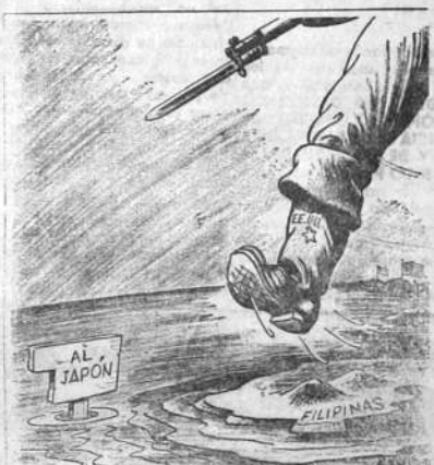
Almanac, con el P.N. (Hollanda, Buitel)

Esa vida que termina de extinguirse cargada de glorias de Mr. D. Lloyd George , bien que sirve de ejemplo para las generaciones actuales y de futuro. Con los hombres como él, señeros de las más austeras virtudes, los pueblos han ido por caminos de felicidad, nos ilumina el caro recuerdo de Battle y las multitudes los han seguido con el arro-bamiento de los poseídos, por que en ellos encontraron la luz de la esperanza para sus dolores y necesidad. La muerte de estos hombres de excepción no truen lágrimas a los ojos, sino que encienden llamaradas en los corazones de los afligidos por la injusticia, para proseguir el camino de las grandes reivindicaciones sociales.