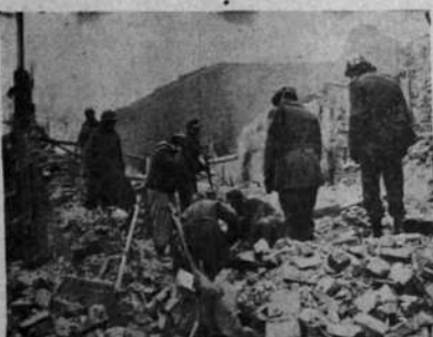
Soldados nazis, tomados prisioneros por fuerzas de los Estados Unidos en el frente occidental, retiran escombros en las calles de una aldea belga.