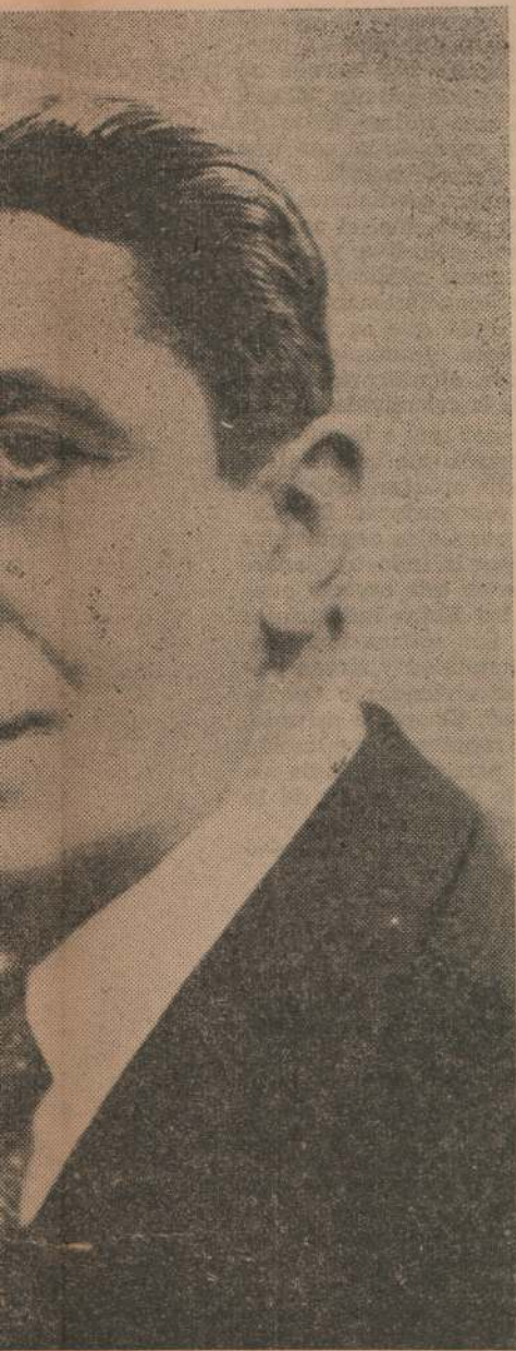
manifestaciones ante la Asamblea de los barrios de la Capital, damos a conocer el problema de la vivienda, el Dr. eficaz realizador, defendiendo los dere-

Mis simpatías todas están con el hombre que hace su trabajo cuando el patrono está presente como cuando se encuentra ausente. Y el hombre que al entregarse una carta para García tranquilamente toma la misiva sin hacer preguntas idiotas y sin intención alguna de arrojarla a la primera alcantarilla que encuentra a su paso o de hacer cosa alguna que no sea entregarla al destinatario, ese hombre nunca queda sin trabajo ni tiene que declararse en huelga para que se le aumente el sueldo. La civilización busca ansiosa, insistentemente a esa clase de hombres. Cualquier cosa que ese hombre pida, la consigue. Se le necesita en toda la ciudad, en todo pueblo, en toda villa, en toda oficina, tienda y fábrica y en todo taller. El mundo entero lo solicita a gritos: se necesita con urgencia al hombre que pueda llevar un "mensaje a García".