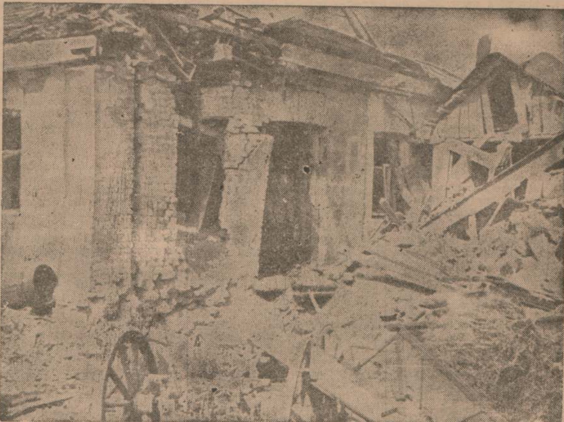
La guerra y la paz: dos polos del destino humano unidos en la referencia gráfica, por la misma demoledora actitud negativa.

todos sus miembros a las audiencias que se realicen.