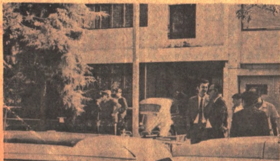
Delante de la casa del Fiscal de Corte en la Av. Rivera N° 5099, adonde acudieron de inmediato de producirse el secuestro: multitud de personas.