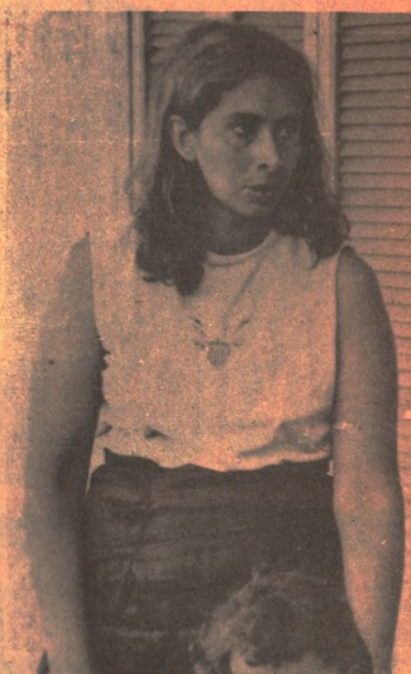
Madre e hija pagan tributo al dolor inenarrable.