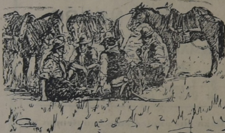
Uno de los cuadros más celebrados de Blanes Viale.

Ugarte y Gonzalez Comisiones Consignaciones Remates Ganaderos Liquidaciones de Estancias Equitaciones de Intendencia YOUNG (C.A.)