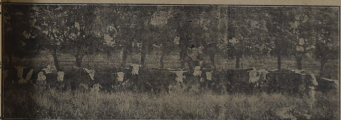
Un hermoso lote de vacas de «El Cambará» que forman parte de los plateltes que se rematarán el 18 de Mayo en la Sociedad Rural por los martilleros Victoria y Ospitaleche.