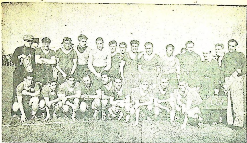
La Selección de la Liga Carmelitana que enfrentara a Peñarol y que se apresta para otros grandes matches

pitonero y Nattero y F. es. y Hernández en io de