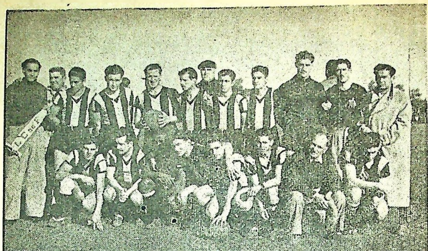
El equipo del C. A. Peñarol de Montevideo que brindó un gran espectáculo el 18 de Julio en Carmelo