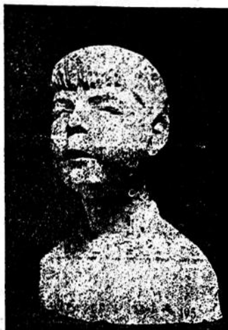
«NIÑO»—INTERESANTE OBRA DE ARTE DEL RESULTO COMPATRIOTA HOMERO BAIS. AUTOR DEL BAJORRELIEVO RECIENTEMENTE INAUGURADO EN EL LICEO DEPARTAMENTAL.

habilitado el miércoles pasado, quedando solucionado así el problema de esa vía de comunicación que tanto perjudicaba a nuestra población, y en particular a las empresas de transporte.