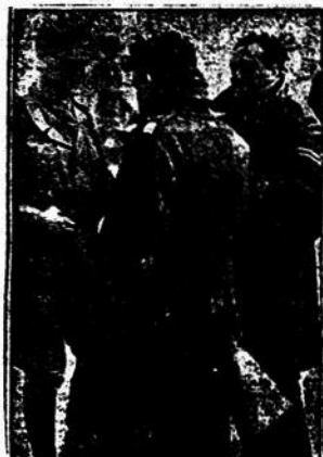
Un soldado alemán con los primeros prisioneros de guerra ingleses en la frontera de Libia.

Berlin.—(TO) El alto mando alemán anuncia el fin del acorazado alemán "Bismarck" que