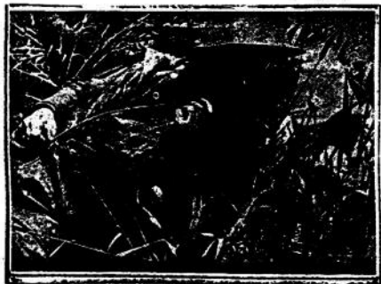
Este soldado inglés, hecho prisionero por los alemanes en Grecia, no quiere saber más nada de la guerra.

Estas voces inglesas son interpretadas en el mundo neutral en el sentido de que Inglaterra trata por todos los medios de obligar a EE. UU. a que sangre como Inglaterra misma, y aun cuando se produjera un desangramiento común. Y también frente a Francia busca Inglaterra según sus propios comentaristas, una decisión, y aunque ésta fuera por las armas. Pesa en esta exigencia el principio de que es mejor para Inglaterra encontrarse en guerra abierta con Francia que no en una situación que permita a Francia cualquier apoyo indirecto—las Potencias del Eje. Puesto que Francia o por lo menos su región ocupada, es prácticamente territorio de guerra, los efectos se sentirán especialmente en su reino colonial. Y en las actuales luchas por la hegemonía del Medite-