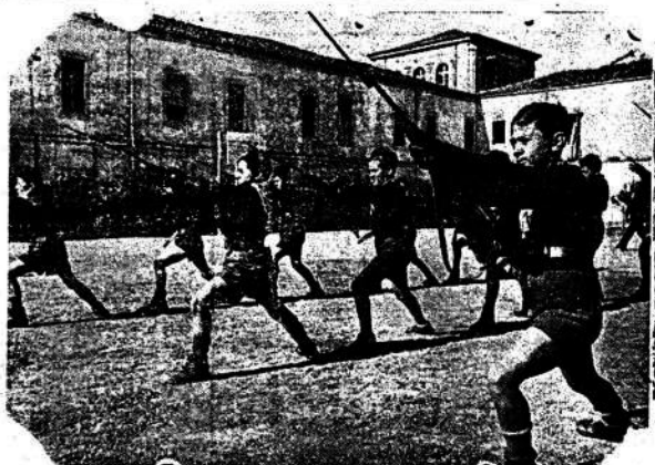
ITALIA.—Miembros de la juventud italiana—de la Baililla—durante los ejercicios con fusiles.