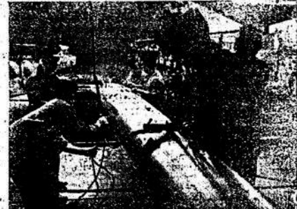
Munición han llegado y con toda cuidado son subidas a bordo de los buques alemanes en los puertos.

a sus respectivos gobiernos en esta tarea tan difícil y unánime todas las energías y todas las fuerzas con el único propósito de salir de lo que, al parecer, deja tan poca esperanza, pero las fuerzas unidas podrán producir un milagro y si este milagro se produjera, sería la salvación. (TO)