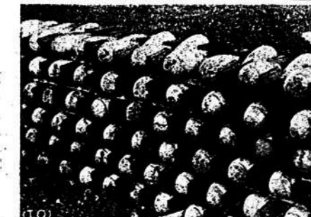
Después de terminada la lucha por un aeródromo soviético.