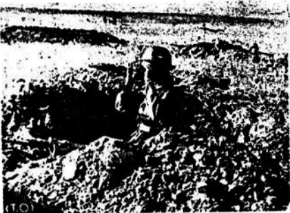
Avanzadas de la infantería alemana en territorio soviético