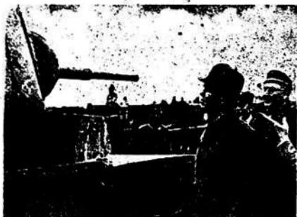
DE LA CONQUISTA DE SALLA.

Administración: Independencia 684 Telé 196. - CIUDAD DE FLORIDA