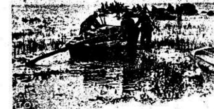
Una flotilla de botes de asol o se prepara el ataque contra el enemigo en el Lago Peipus