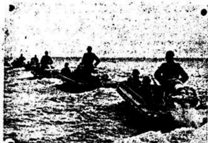
Botes de asalto en el lago Pelpus

Art. 5.º—Comuníquese publíquese etc. (El término de 90 días vence el 31 de Enero de 1942).