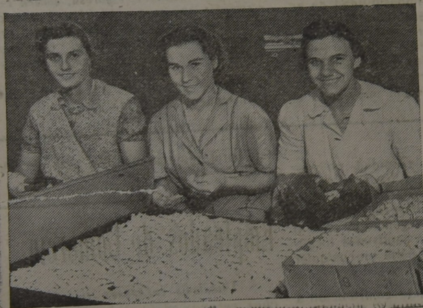
Obreras inglesas en una fábrica de tornillos para tanques

—Es que Jesús tuvo dos compañías; al nacer la de un buey y un asno, al morir, la