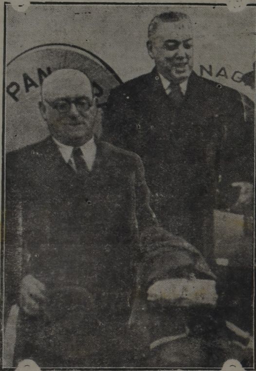
El General José Miaja y el Presidente de las Cortes Españolas Don Diego Martínez Barrio, descendiendo del avión en S. de Chile, en su viaje de Méjico a Montevideo

Todo el pueblo democrático debe concurrir al Teatro Young a escuchar la vibrante y autorizada palabra de los ilustres representantes del pueblo español, Gral. J. Miaja y D. Diego Martínez Barrio