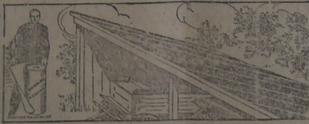
PARA EL GALPON