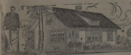
PARA LA HABITACION

Al principio, hace ya muchos años, cuando iniciamos la importación de este techado, los interesados lo compraban como para hacer experimentos. Hoy, que los años y la práctica lo han consagrado como el techo ideal para toda clase de construcciones, sin excepción, su uso se ha generalizado a tal punto que muchas veces la demanda supera la importación. Y si el artículo no fuera de primer orden, no lo venderíamos nosotros.