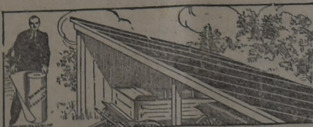
PARA EL GALPON