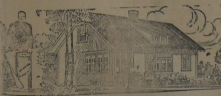
PARA LA HABITACION

Al principio, hace ya muchos años, cuando iniciamos la importación de este techado, los interesados lo compraban como para hacer experimentos. Hoy, que los años y la práctica lo han consagrado como el techo ideal para toda clase de construcciones, sin excepción, su uso se ha generalizado a tal punto que muchas veces la demanda supera la importación. Y si el artículo no fuera de primer orden, no lo venderíamos nosotros.