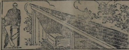
PARA EL GALPON