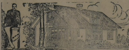
PARA LA HABITACIÓN

Al principio, hace ya muchos años, cuando iniciamos la importación de este techado, los interesados lo compraban como para hacer experimentos. Hoy, que los años y la práctica lo han consagrado como el techo ideal para toda clase de construcciones, sin excepción, su uso se ha generalizado a tal punto que muchas veces la demanda supera la importación. Y si el artículo no fuera de primer orden, no lo venderíamos nosotros.