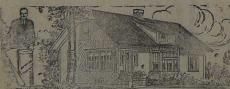
PARA LA HABITACIÓN

AL principio, hace ya muchos años, cuando iniciamos la importación de este techado, los interesados lo compraban como para hacer experimentos. Hoy, que los años y la práctica lo han consagrado como el techo ideal para toda clase de construcciones, sin excepción, su uso se ha generalizado a tal punto que muchas veces la demanda supera la importación. Y si el artículo no fuera de primer orden, no lo venderíamos nosotros.