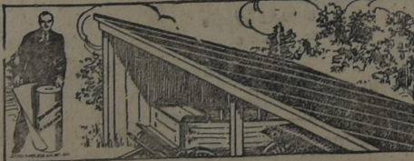
PARA EL GALPÓN