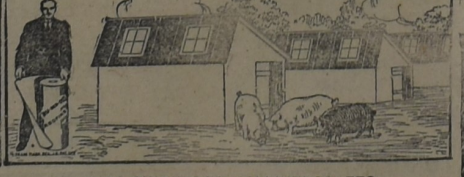
PARA CHIQUEROS, GALLINEROS, ETC.

Enviamos, a solicitud, muestras de los diferentes tipos, instrucciones para su colocación, precios y demás detalles de interés.